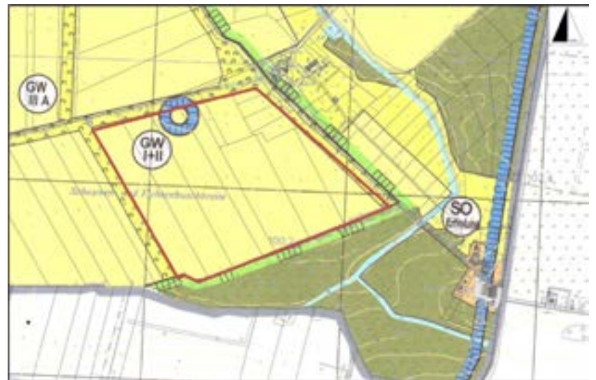
Abgrenzung des Änderungsbereiches

Die Beteiligung der Behörden und der sonstigen Träger öffentlicher Belange, deren Aufgabenbereich durch die Planung berührt werden kann, gemäß § 4 Absatz 1 Baugesetzbuch und die Abstimmung mit den Nachbargemeinden gemäß § 2 Absatz 2 Baugesetzbuch wird entsprechend durchgeführt.