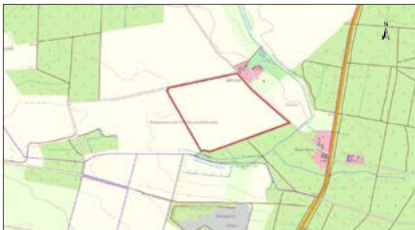
Abgrenzung des Geltungsbereichs des Bebauungsplanes

Für Rückfragen zur Planung steht neben dem Bau- und Bürgeramt der Stadt Bad Dübén (Tel.: 034243/72265, E-Mail: stadt@bad-dueben.de) auch die mit der Planung beauftragte Büro Knoblich GmbH Landschaftsarchitekten (Zur Mulde 25, 04838 Zschepplin, Tel.: 03423/758600, Fax: 03423/7586059, E-Mail: beteiligung@bk-landschaftsarchitekten.de) zur Verfügung.